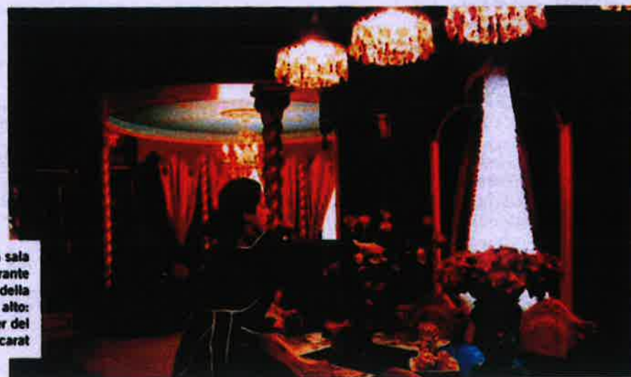
Accanto: la sala di un ristorante di lusso della capitale. In alto: il manager del negozio Baccarat

Le aziende russe private e statali hanno avuto credito facile. Ma ora chiedono aiuto