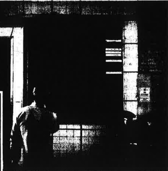
Due reclute in attesa di un treno alla stazione di Khabarovsk, Russia orientale. A sinistra: un istruttore per i tank a Kovrov, vicino Mosca. Sopra, da sinistra: un giovane ingegnere in una base in Abkhazia e soldati in esercitazione su un carro armato

sono un dettaglio che viene volentieri trascurato. I veterani hanno gli sconti ai musei e evitano la fila nei supermercati, e ogni 9 maggio sfilano sulla Piazza Rossa con le uniformi ingiallite cariche di medaglie o si radunano al Gorky Park, dove anche la gioventù russa, irriverente e nichilista quantomai, non disdegna di farsi fotografare con i nonni della patria. Il 9 maggio 2005 Putin celebrava con tutti i potenti della terra il sessantenario della vittoria sovietica: tre anni dopo, questo prossimo 9 maggio, per la prima volta dal 1990 saranno passati in rassegna anche i settori pesanti dell'esercito russo. Sarà un riflesso degli eventi della politica estera di questi anni e del rinnovato desiderio di "dershava" (potenza), ma quest'anno vedremo la Piazza Rossa coperta dai missili terra-aria S-300, i jet Su-27 e MiG-29, i veicoli da combat-