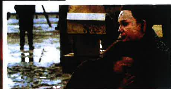
Un'immagine de "Il soldato di carta". A fianco: il caffè il Giardino dei ciliegi sulla Piazza Rossa. Nell'altra pagina: l'incrociatore Aurora e il musical "Caterina la Grande"

un comandante delle truppe zariste in Siberia, distintosi per particolare brutalità. Spiega lo storico Simon Sebag Montefiori: «La brutalità è un tratto indispensabile del potere imperiale russo: non importa se zarista o comunista». Infatti, lo scrittore Vladimir Sorokin, un eretico, ha appena pubblicato