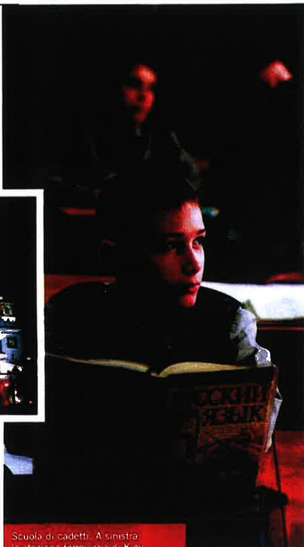
Scuola di cadetti. A sinistra: la stazione ferroviaria di Kiev a Mosca. Nell'altra pagina: la locomotiva della Transiberiana e il negozio Eliseevskij nella capitale

dell'Ottocento. Uno di loro ha l'aria di chi comanda. Ai fianchi del marziale gruppetto, stendardi con aquila bicipite dorata in alto, e bandiere con la "N" di Napoleone nel fango. L'uomo al comando è il generale Kutuzov mentre sconfigge le truppe dell'imperatore francese. Benvenuti nella Russia del Terzo millennio, paese dove, in un sapiente gioco di specchi, di citazioni e di rimandi, Kutuzov l'eroe dell'Ottocento richiama i marescialli di Stalin, mentre il bolscevico Stalin è un'incarnazione degli zar, in una girandola di simboli, una volta nemici gli uni degli altri, e che oggi invece in un sincreti-